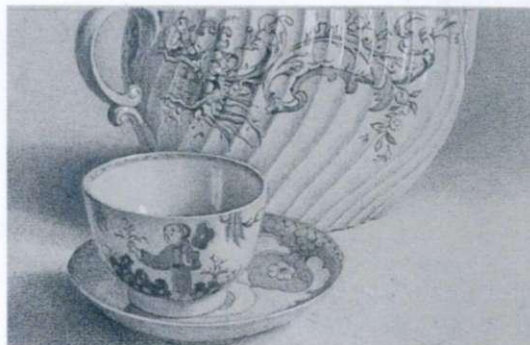
La tazza cinese