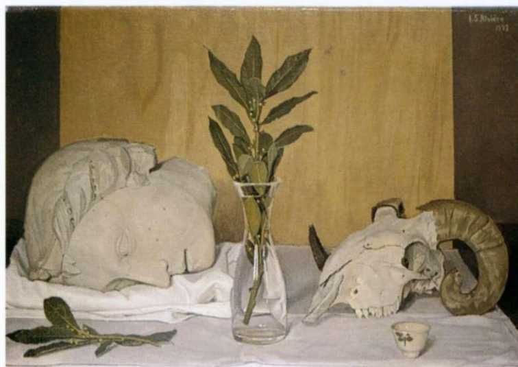
Testa di Angelo con alloro