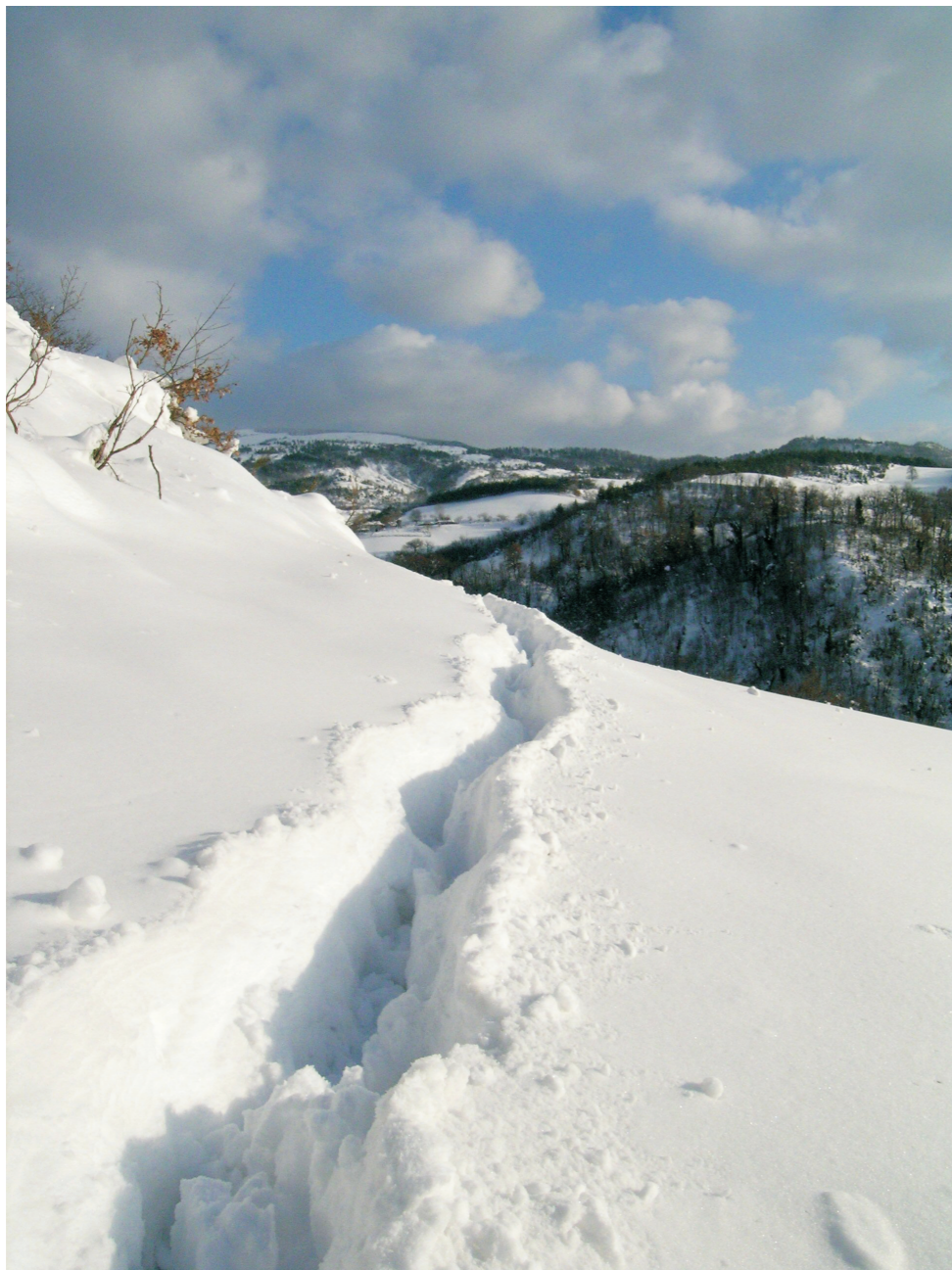
Il segno, il senso

Voglio lasciare il segno. L'impronta dei miei passi faticosa impressa sulla strada. Memorabile. Come sulla neve fuoco. Umilmente tenace. Ed ambiziosa.