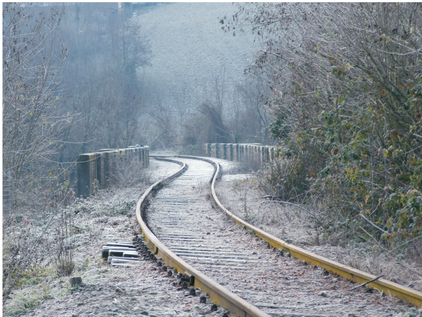
La brina sulla ferrovia