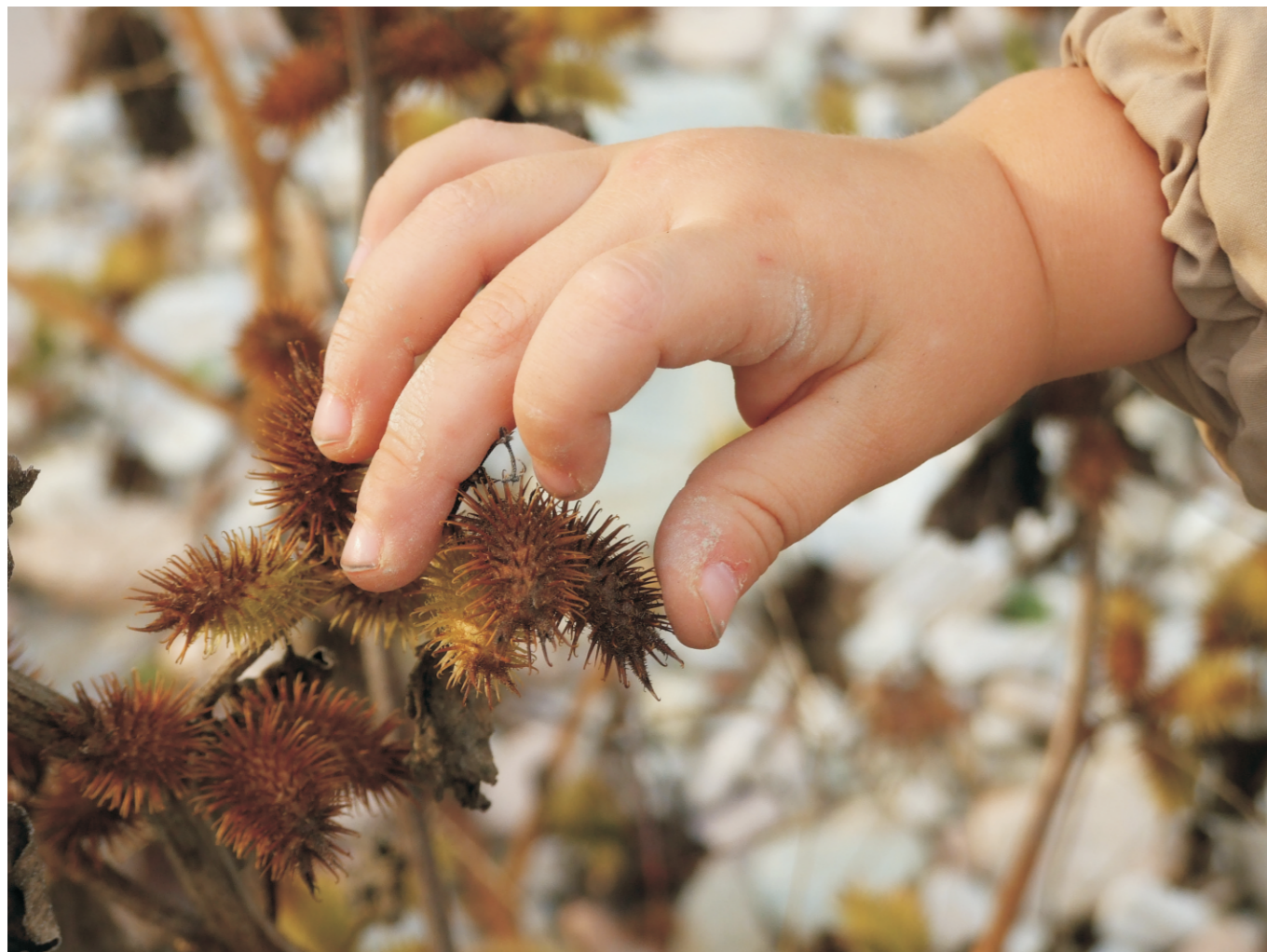
L'edera e la foglia

Coglie la tua mano il frutto del suo tempo.