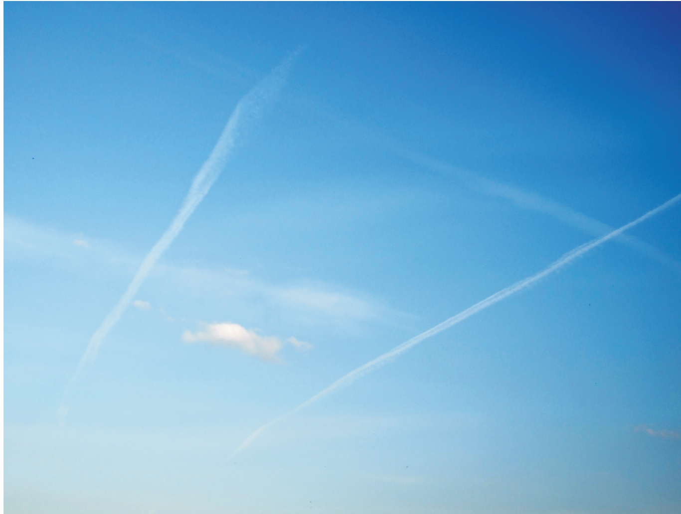
Segnali di fumo

Cammino. Anzi corro. Diritto. Senza mai guardar per terra. Una guerra. Di passi. E lampi di pensieri.